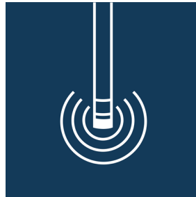
Sonden + Elektronik